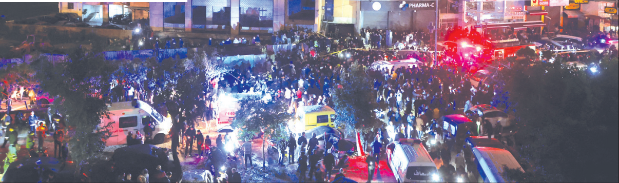
بيروت - موقع مكتب الشهيد صالح العاروري في الضاحية الجنوبية بعد قصفه من قبل طائرة اسرائيلية مسيرة أمس.