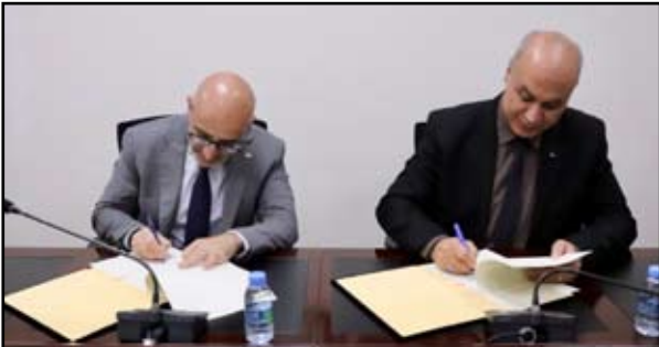
الثقافة وتعزيز مساهمته في التنمية الاقتصادية والاجتماعية في فلسطين.

وتنص الاتفاقية التي وقعت في رام الله، أمس الخميس، على رفع الوعي بين رواد الأعمال الثقافيين والعنيين حول الإمكانيات الاقتصادية للصناعات الثقافية والإبداعية، ودعم تنفيذ مشاريع مدّرة للدخل ومبادرات ريادية في قطاعي الفنون والثقافة، بالإضافة لتعزيز الإنتاج والتوزيع الثقافي في المناطق الريفية والناحية، والإسهام في خلق فرص عمل للشباب والنساء في الصناعات الثقافية والإبداعية.