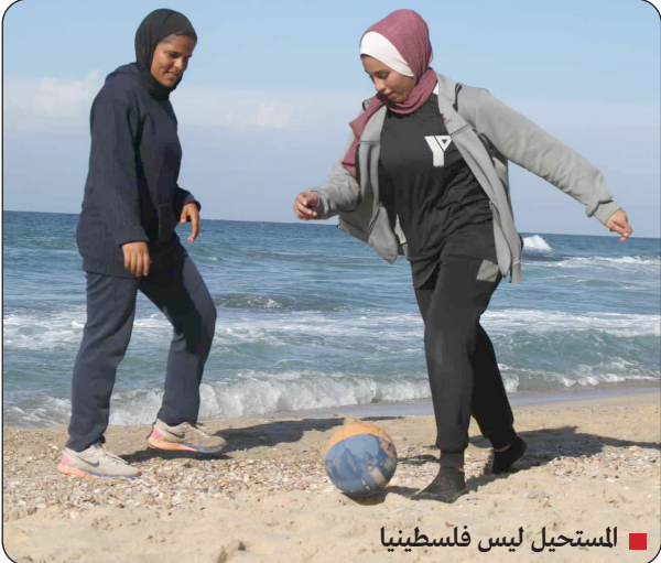
للتسحيل ليس فلسطينيا