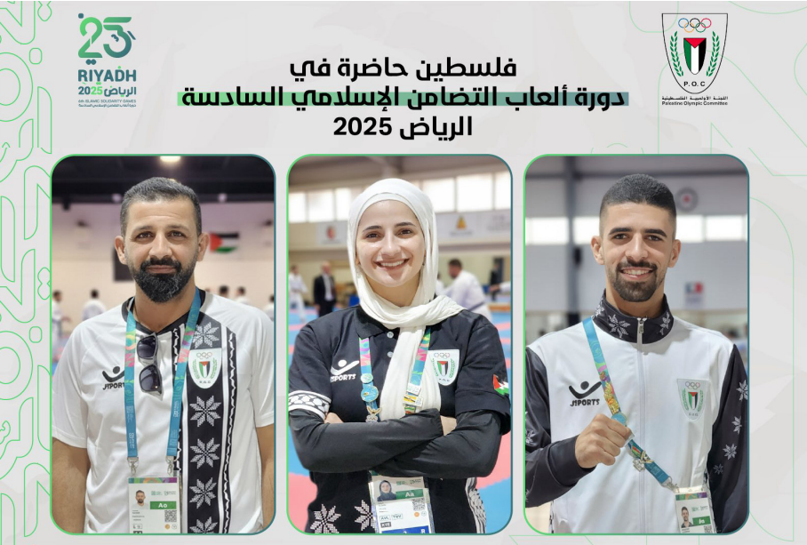
أبطال الكاراتيه جاهزون

تعزف تركيا وحدها في أولبياد التضامن الإسلامي، ويحصد أحفاد عثمان الذهب النفيس في معظم المسابقات، لأنهم أخذوا الدورة على محمل الجدّ، ونقلوا ثمار تجربة احتكاكهم برياضي القارة العجوز إلى الدورة الإسلامية، على أمل أن يدرس قادة الرياضة في بلاد اللهارين التجربة التركية، واستخلاص العبر من تراكم اخفاقات الأبطال العرب والسلمين، الذي بيد أنّ أول أسبابه التبذير في الإنفاق على الجلد للنفوخ، والتقتير في الصرف على الألعاب الفردية!